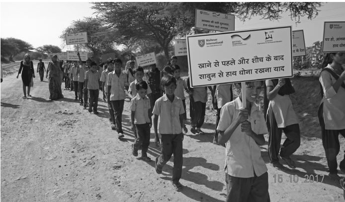
શાળાનાં બાળકો દ્વારા રેલી - સિંઘરી, બાડમેર, રાજસ્થાન

‘ગ્લોબલ હેન્ડવોશિંગ ડે’ની શરૂઆત ઓગસ્ટ, 2008માં ‘ગ્લોબલ હેન્ડવોશિંગ પાર્ટનરશીપ’ (જીએચપી) દ્વારા સ્ટોકહોમ, સ્વિડન ખાતે ‘વિશ્વ જળ સપ્તાહ’માં કરવામાં આવી હતી. પહેલો ‘ગ્લોબલ હેન્ડવોશિંગ ડે’ સંયુક્ત રાષ્ટ્ર મહાસભા દ્વારા નિયત કરેલી તારીખ 15મી ઓક્ટોબર, 2008ના રોજ મનાવાયો હતો અને 2008ના વર્ષને આંતરરાષ્ટ્રીય સ્વચ્છતા વર્ષ જાહેર કરવામાં આવ્યું હતું. આ દિવસ મનાવવા પાછળનો ઉદ્દેશ્ય લોકોને પ્રોત્સાહિત કરવાનો અને સાબુથી હાથ ધોવાની વૈશ્વિક અને સ્થાનિક દ્રષ્ટિને વેગ આપવા