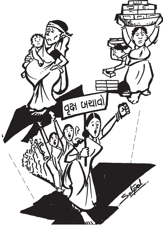
મહિલાઓના વિકાસ અંગે બદલાતા દૃષ્ટિકોણ

વિકાસ ક્ષેત્રે દરમ્યાનગીરી છતાં પણ મહિલાઓનાં હિતોને અવગણવામાં આવ્યાં છે અને તે છેવાડે ધકેલાઈ ગયાં છે એમ વધારે ને વધારે સમજાવા માંડ્યું છે. ગરીબોમાં પણ તેમની સંખ્યા વધતી જાય છે. ‘સંયુક્ત રાષ્ટ્ર વિકાસ કાર્યક્રમ’ (યુએનડીપી)નો અહેવાલ એમ જણાવે છે કે ગરીબીની રેખાની નીચે જીવતા અંદાજે ૧૫૦ કરોડ લોકોમાં ૭૦ ટકા તો મહિલાઓ છે. એમ દર્શાવવા માટે પૂરતા પુરાવા છે કે દુનિયાભરમાં ગરીબી વેઠનારાઓમાં મહિલાઓ મોખરે છે અને કુટુંબ સ્તરે ગરીબીનો બોજો તેઓ અસમાન રીતે વેઠે છે.