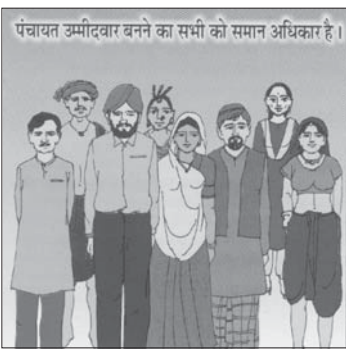
પંચાયત ઝમીંદવાર બનને કા સમી કો સમાન અધિકાર હૈ।

૨૪ રંગીન ચિત્રોવાળાં કાર્ડની જોડીઓ એટલે કે ૪૮ ચિત્રો થયાં. તેમાં રમત સંબંધી પુસ્તિકા દરેક ચિત્રકાર્ડના જોડામાં છે. તેમાં પંચાયતી રાજ વ્યવસ્થાના ૭૩ બંધારણીય સુધારા અન્વયે કરવામાં આવેલી જોગવાઈઓના કોઈ એક પાસા વિશે જાણકારી આપવામાં આવી છે.